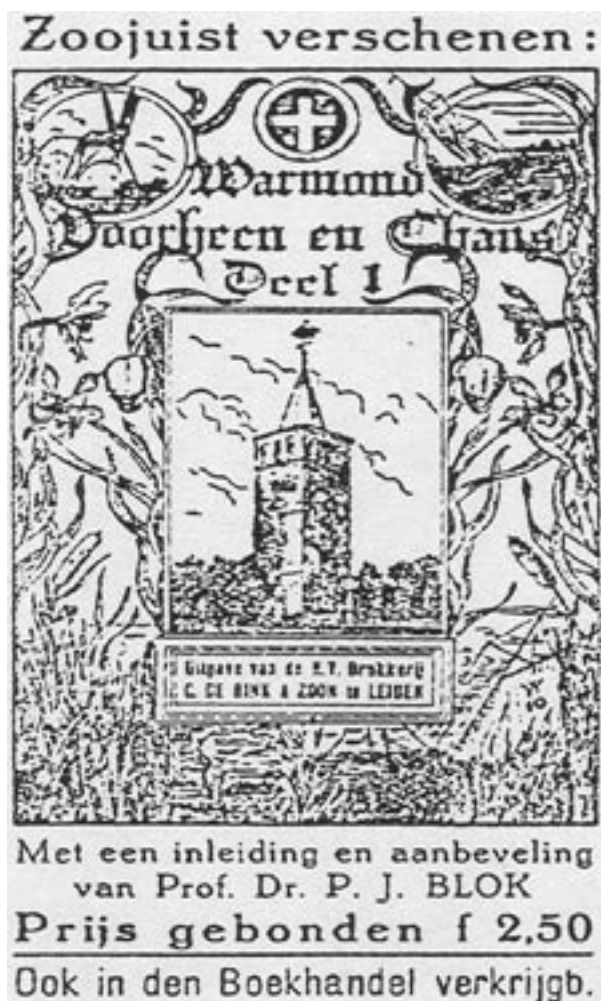
Afb. 4 Aankondiging van het eerste deel van Warmond Voorheen en Thans , 1923.

hij hoopt dat het gemeentebestuur van Warmond de uitgave hiervan nog eens mogelijk zal maken. Voorts dat het tweede deel uit drie afdelingen bestaat: 1. Het stienhuys tot Warmonde en het huis Oud-Teylinghe of Lochorst. 2. Oud-Alkemade en de Hofstede Oud-Endepoel, en 3. de Woning der Heeren van Warmond benevens de Hofsteden Oostergeest en Henmeer of Oostwoud, waarvan hij de eerste aflevering nu in het licht geeft, mogelijk geworden door de financiële hulp van eenige heeren . Op de titelbladzijde zal dus kennelijk een n achter ridderhofstede weggevallen zijn, waardoor deze titel verklaard kan worden als de titel die voor alle drie de afdelingen van het tweede deel bedoeld was. Deze eerste aflevering van het tweede deel bevat de beschrijving van het oude slot Teylingen - het zogenaamde stienhuys van Dirc van Teilinghe en van